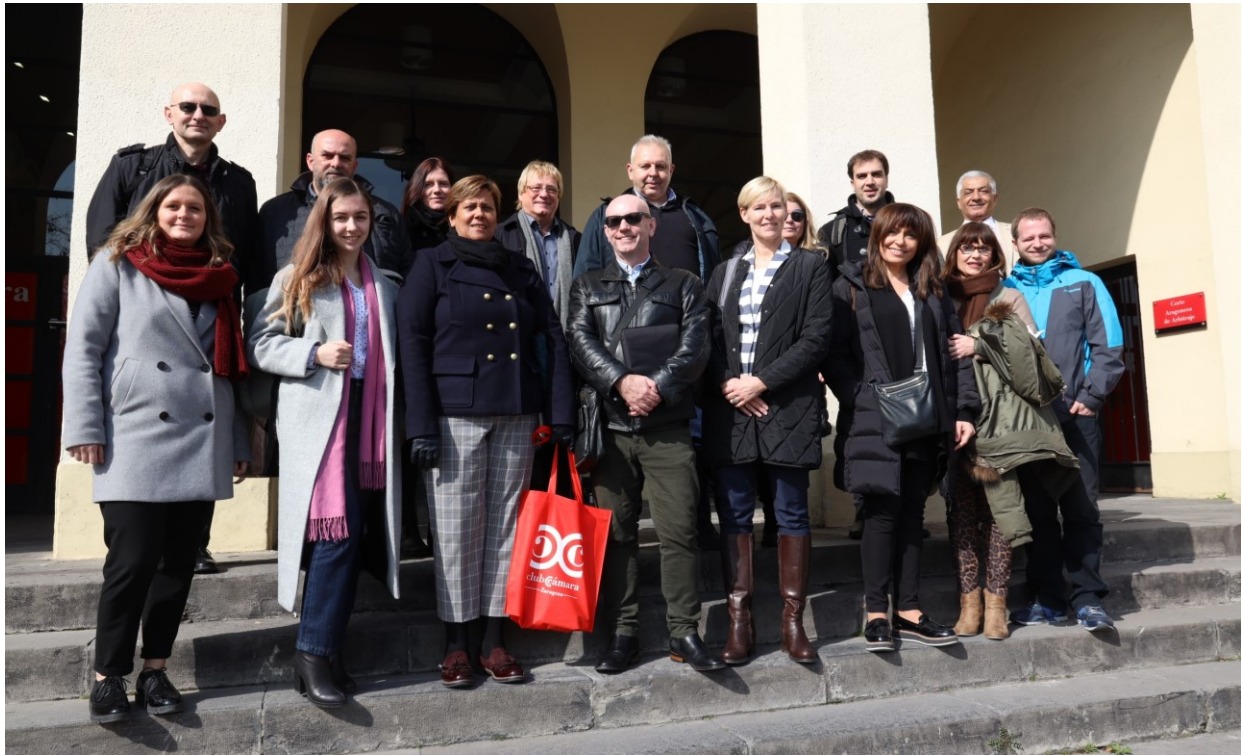
Οι Έτεροι του έργου στην Ισπανία πρίν την πανδημία COVID-19