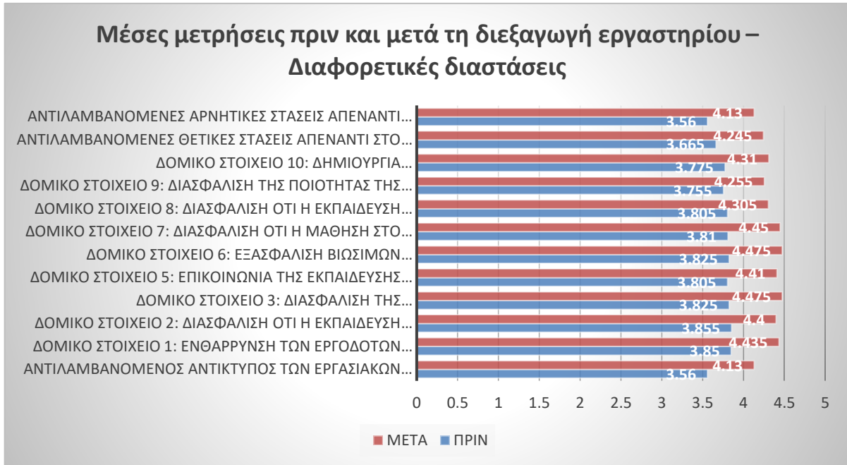
Σχήμα 2: Μέσες μετρήσεις πριν και μετά τη διεξαγωγή εργαστηρίου - Διαφορετικές διαστάσεις

Όπως είναι φανερό από τις αξιολογήσεις των συμμετεχόντων, το υλικό που δημιουργήθηκε για τις ανάγκες αυτού του εργαστηρίου ήταν ενδιαφέρον και αποτελεσματικό . Παρά τα πολλά θετικά σχόλια, η αναφορά που αναπτύχθηκε βάσει των αποτελεσμάτων του εργαστηρίου, επικεντρώθηκε επίσης στις αδυναμίες που εντοπίστηκαν από τους συμμετέχοντες και τους εκπαιδευτές του εργαστηρίου, όπως η έλλειψη στοιχείων που σχετίζονται με την ενεργητική μάθηση (π.χ. πρακτικές δραστηριότητες, ασκήσεις επίλυσης προβλημάτων κτλ.) από ορισμένα μέρη του περιεχομένου της κατάρτισης.