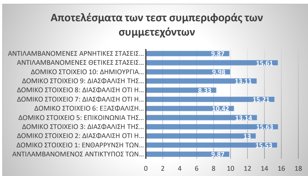
Σχήμα 1: Μέση ποσοστιαία μεταβολή στα δομικά στοιχεία της εκπαίδευσης ενηλίκων στο χώρο εργασίας και αντιλαμβανόμενος αντίκτυπος της μάθησης στο χώρο εργασίας.

Όπως απεικονίζεται στον παρακάτω πίνακα, παρατηρήθηκε σημαντική θετική αλλαγή στάσης μετά τη διεξαγωγή των εργαστηρίων με περίπου 100 συμμετέχοντες από Αυστρία, Κύπρο, Γαλλία, Ελλάδα και Ισπανία. Τα συγκεντρωτικά αποτελέσματα από τα τεστ συμπεριφοράς που εφαρμόστηκαν στις πέντε ευρωπαϊκές παρουσιάζονται παρακάτω στα σχήματα 1 και 2. Από τα αποτελέσματα φαίνεται ότι υπήρξε μία αύξηση στην αντίληψη των συμμετεχόντων σχετικά με τη μάθηση στο χώρο εργασίας και του θετικού της αντίκτυπου στους χώρους εργασίας. Η μέτρηση της αλλαγής σε όλα τα δομικά στοιχεία των αποτελεσματικών πολιτικών μάθησης ενηλίκων καθώς και στις προκλήσεις που αντιμετωπίζονται μέσω της μάθησης στο χώρο εργασίας, έδειξε επίσης μία αύξηση (θετική αλλαγή) χωρίς καμία εξαίρεση.